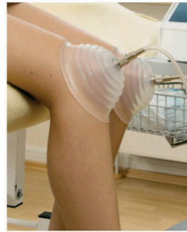
Mobilisation bei Kniebeschwerden