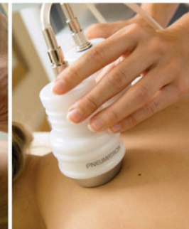
Thermobehandlung bei Rückenproblemen