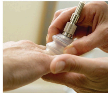
Behandlung der kleinen Gelenke